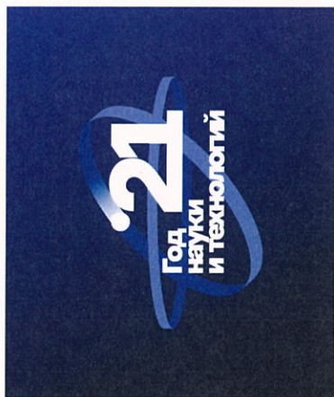
Логотип для темных фонов